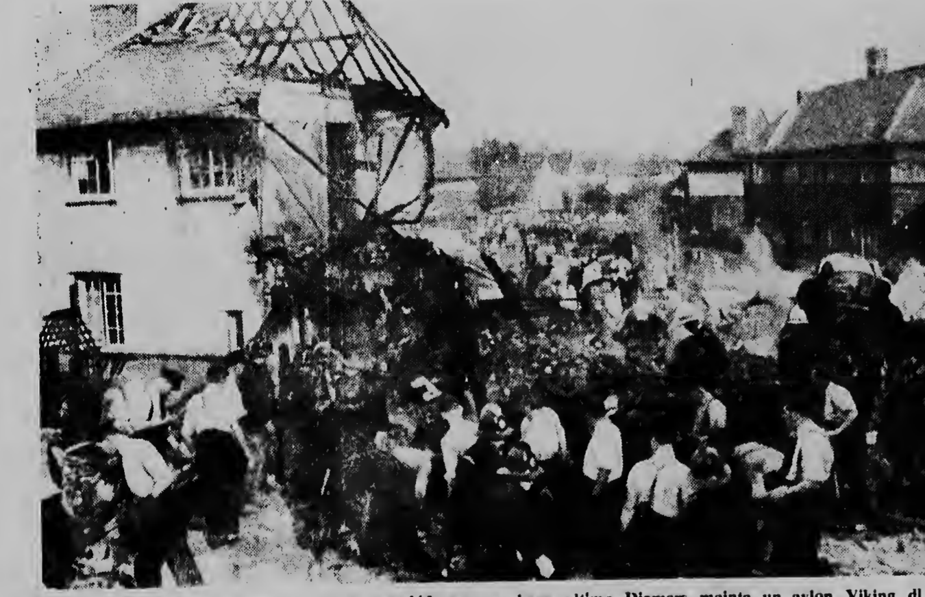
Segun calculo como bini hende a perde nan bida ora en slman nitimo Diamars mainta un avion Viking di dus motor di Independent Air Lines cu tabata vlahando pa Nize, a val den dje suburbio di Sonthall riba un rij di cas. Door dje desgracia a resultu na incendio loke a aumenta e danjo considerablemente. E telefata aki ta duna un idea di e trabao di salvacion. E loke a sobra die aeroplano ta visto entre dje ruinanan dje casnan. Den un dje-casnan ei un mama cu su baby cu a caba di uace a hanja non worto.